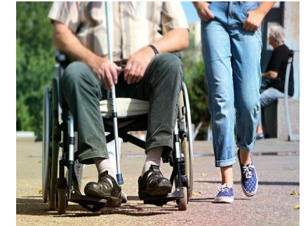
Rede de Atenção à Pessoa com Deficiência

Por ocasião da elaboração do Plano de Saúde Regional