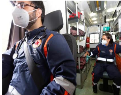
Rede Urgência e Emergência