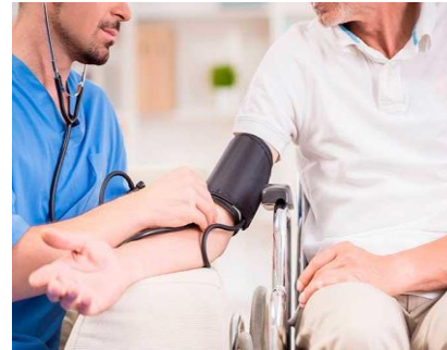
Rede de Atenção às DCNT