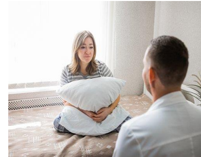
Rede de Atenção Psicossocial