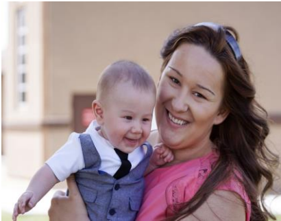
Rede Materno Infantil